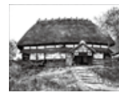
《マタギの家》 [秋田県北秋田郡阿仁町根子]1963年

向井潤吉が民家を前に制作した現地制作の作品とともに、アトリエで手がけた大作を展示し、その比較から向井の風景へのまなざしと、様々な表現技法を探ります。