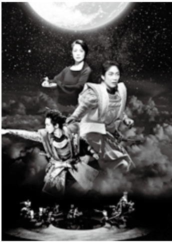
デザイン: 秋澤一彰