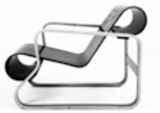
アルヴァ・アールト《41 アームチェア バイミオ》1932/73年

根ざした建築を目指す姿勢——その原点は、もう一人のアールト、妻・アイノ(1894-1949)の強い信念によってかたちづけられたものでした。アイノがまだ無名のアルヴァと出会ってから先に没するまで、互いを補い合いながら同じ理想を共有した25年間の軌跡を、初公開となる貴重な数多くの資料をまじえてご紹介します。