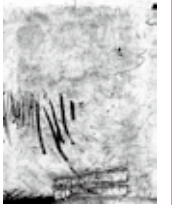
《Painting No.SF3564》 1964年