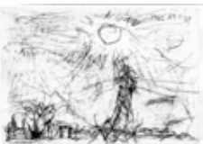
麻生三郎《三軒茶屋》1963年

世田谷で最初に開通し、「玉電」の愛称で親しまれた玉川電気鉄道(現・東急田園都市線・東急世田谷線)。本展では、沿線の三軒茶屋や桜新町などで活動した美術家をはじめとする、文化人同士の創作と交流の足跡をたどります。