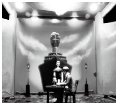
《題のない歌》2016年 原作：萩原朔太郎 「題のない歌」