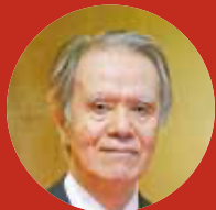
今藤政太郎