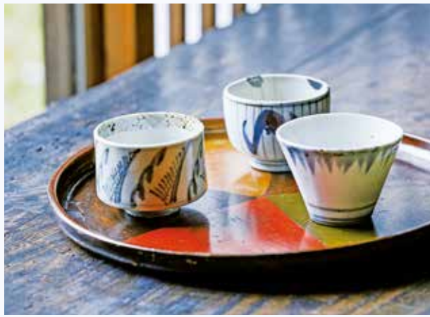
(手前)塗分盆 江戸時代 18世紀 / (盆上左から)染付羊園文湯呑、染付瑞雲文湯呑、染付雨降文猪口 肥前有田(佐賀) 江戸時代 18-19世紀 いずれも日本民藝館蔵

日々の暮らしで使われていた手仕事の品の「美」に注目した思想家・柳宗悦(1889-1961)は、無名の職人たちによる民衆的工芸を「民藝」と呼びました。本展は、美しい民藝の品々を「衣・食・住」のテーマに沿って展示するほか、今も続く民藝の産地を訪ね、その作り手と、受け継がれている手仕事を紹介します。さらには現代のライフスタイルにおける民藝まで視野を広げ、その拡がりや現在、これからを展望します。