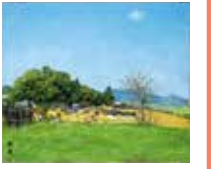
甘藷丘遠望—橋寺境内より [奈良県高市郡明日香村大字橋] 1970年

草屋根の民家を描き続けた洋画家・向井潤吉(1901-1995)。作品に描かれた「空」に目を向け、空や天候に注目して作品をご紹介します。