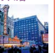
シカゴにて 1951-54年

画家・清川泰次(1919-2000)は、1951年より約3年間滞米し、その後ヨーロッパやアジアを旅しました。訪れた先々で、まだ珍しかったカラーフィルムを用いて撮影された写真をご紹介します。