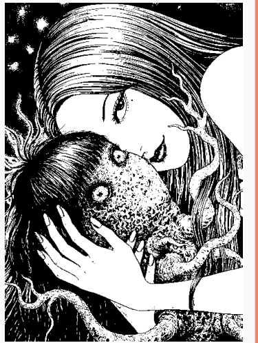
《富江・チーククラブ》2023年

美しくもグロテスクな世界を描き出す漫画家・伊藤潤二。本展は伊藤潤二初の大規模な個展として、自筆原画やイラスト、絵画作品を展示します。人間の本能的な恐怖心や忌避感を巧みに作品に映し出しながらも、日常と非日常、ホラーとユーモアを自在に行き来する作品世界に「震える”ひと時をお楽しみください。 一般1,000(800)円/65歳以上、高校・大学生600(480)円/小・中学生300(240)円 ※( )内は20名以上の団体料金 ※障害者割引あり